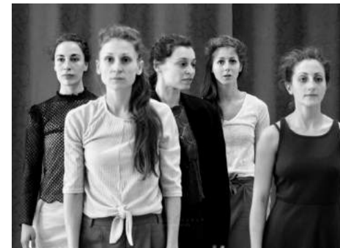
Répétitions mai 2018, accueil studio Pôle danse CMN / L'hélice