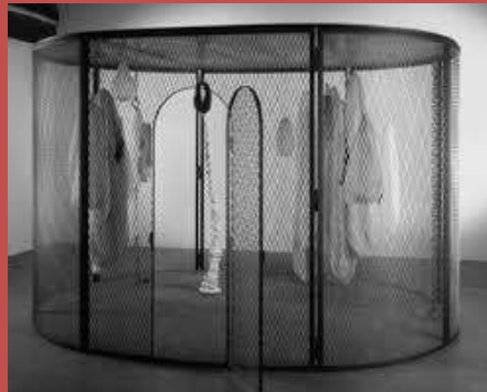
Peaux de lapin, chiffons ferrailles à vendre 2006