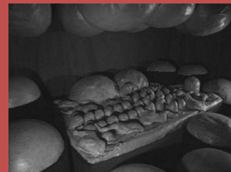
The destruction of the father 1974