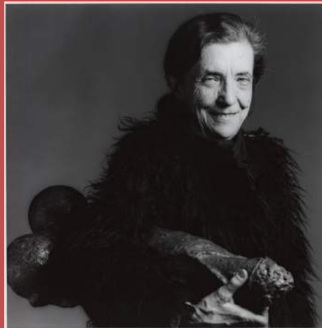
Portrait de Louise Bourgeois tenant « Fillette », 1982

« ... Je suis mon œuvre. Je m'incarne dans les objets que je fabrique » Louise Bourgeois